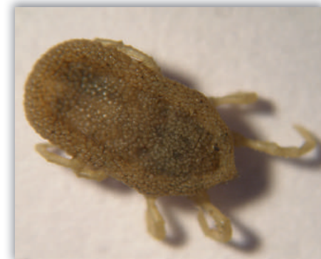
Ornithodoros spp.