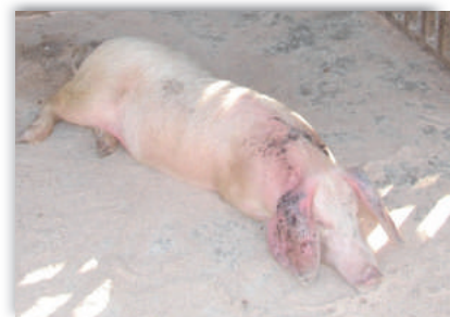
Reduzierte Futtermittelaufnahme, Apathie, Zyanosen, Bewegungsstörungen innerhalb von 24-48h vor Eintritt des Todes..