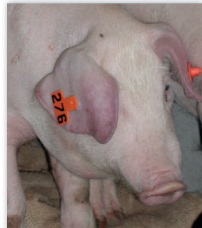
Rötung der Ohrspitzen