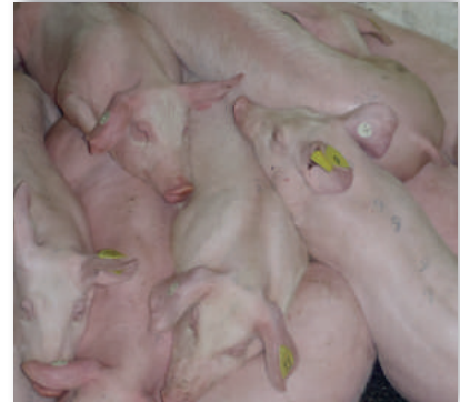
Plötzlicher Tod der Tiere nach nur wenigen klinischen Symptomen..