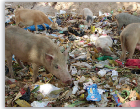
Fütterung auf Müllhalden.